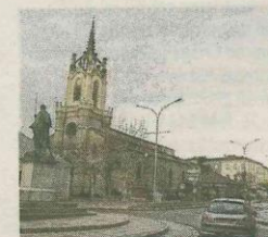
■ Feurs, où se trouve un musée d'archéologie. Yves Salvat